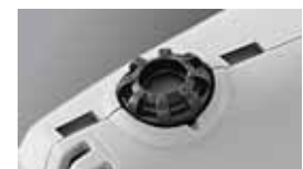
Drehzahlregelung für optimale Sägeblattschwingung