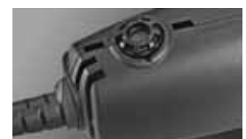
Einfacher Wechsel des Akkus Accu can be easily changed