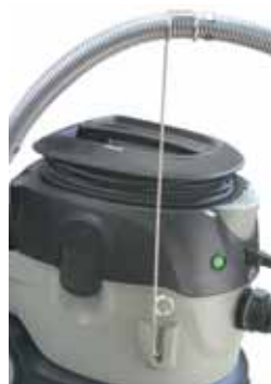
Praktischer Schlauchhalter Applicatory hose clamp