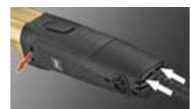
Einfacher Wechsel des Sägeblattes