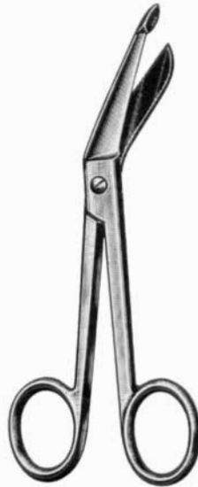
Lister 10-1080 14,0 cm 10-1082 18,0 cm 10-1084 20,0 cm