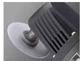
Abgewinkelter Sägekopf Angled Saw Head