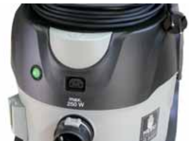
Auto Start / Stop + spezielle Steckverbindungen Auto Start / Stop + special connector