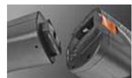
Einfacher Wechsel des Akkus Accu can be easily changed