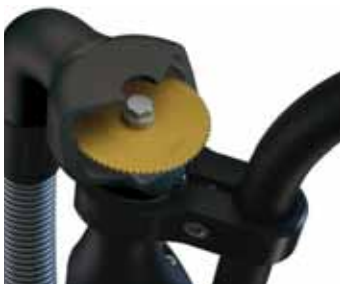
Absaugglocke, nicht einzeln Lieferbar Dust Removal Unit not separate available