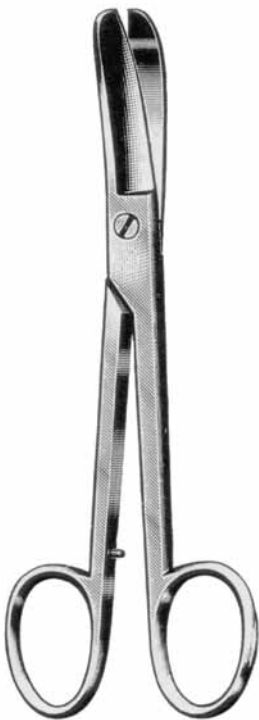
10-1076 Lorenz 23,0cm