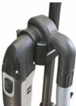
Aufhängung ECO II Hanging kit ECO II

2-polig "USA", 110-120 V, 50-60 Hz 10-1248 2-pole "USA", 110-120 V, 50-60 Hz