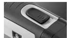
Ergonomischer Ein-/ Aus Schalter