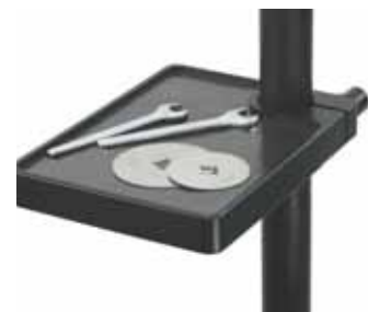
Magnetische Ablage für Sägeblätter und Werkzeug Magnetic placement area for the saw blades and the tools