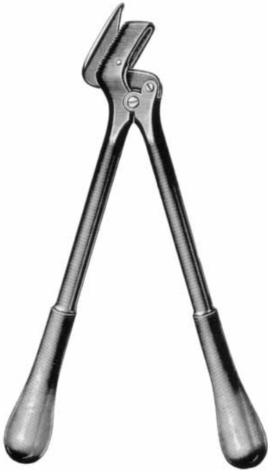
Stille 10-1042 26 cm 10-1044 37 mm