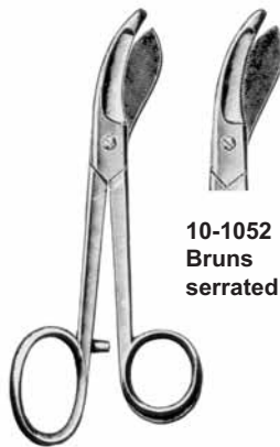
10-1052 Bruns serrated